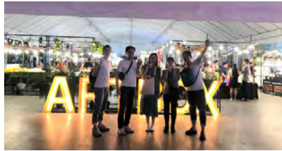
ナイトマーケット

この夏、弊社社員5名が仕入先様の報奨旅行に参加させていただき、タイへ行って来ました。お寺や遺跡をまわって歴史を感じたり、象に乗って文化体験したり、マーケットに行ってお買い物したりと、観光と街を満喫した素晴らしい旅でした(°▽°) XEROXさん、ありがとうございました！