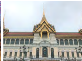
ワットプラケオ（王宮）