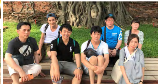
アユタヤ ワットマハタート