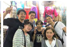
ナイトマーケット